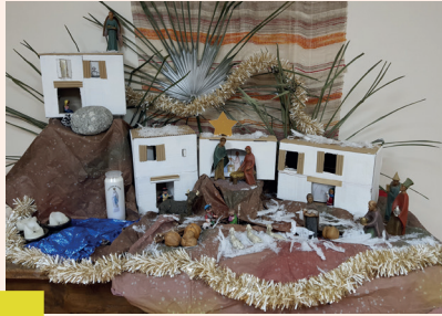
Creche du Foyer élaborée par des Bénévoles et des Résidents