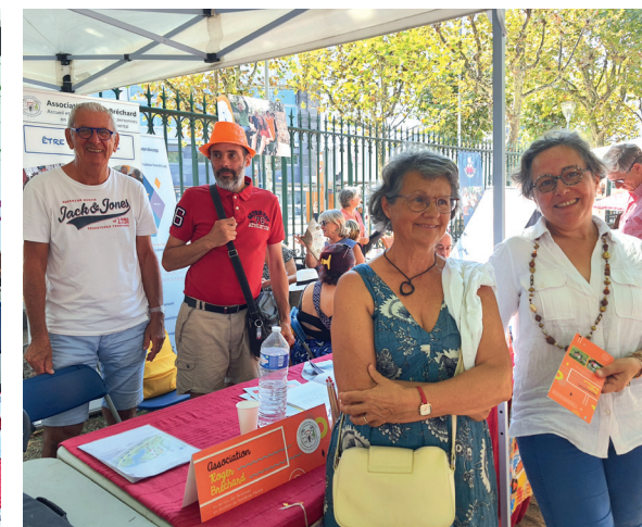
Résident, bénévole et administrateurs réunis.