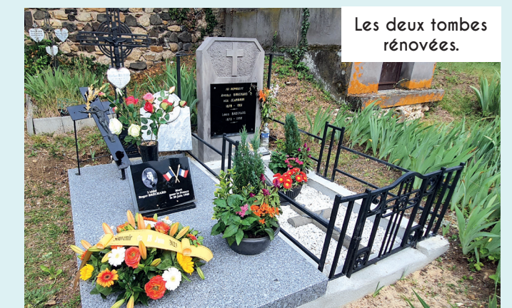
Les deux tombes rénovées.