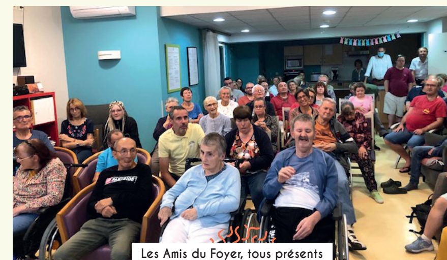
Les Amis du Foyer, tous présents